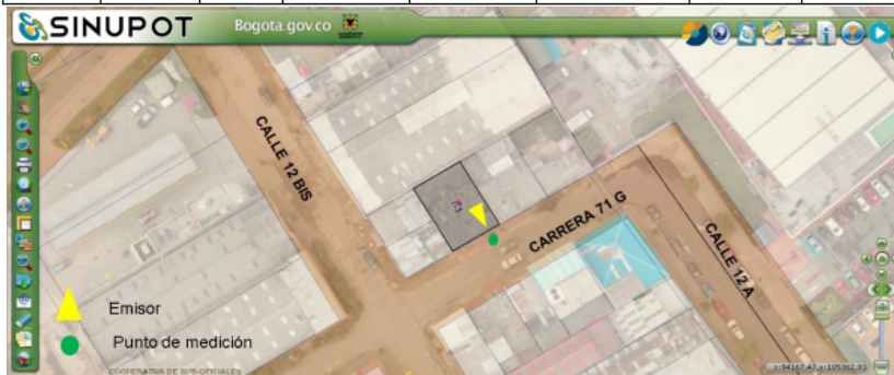
Figura 1. Ubicación del predio emisor y punto de monitoreo.